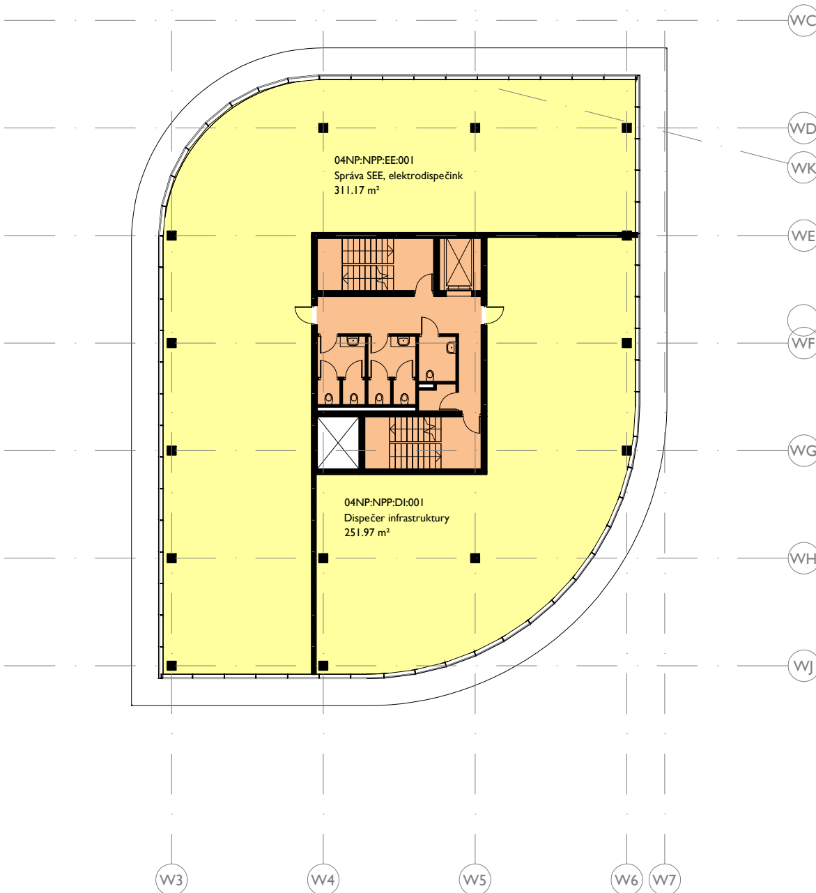
Tabulka místností DÍLNÝ